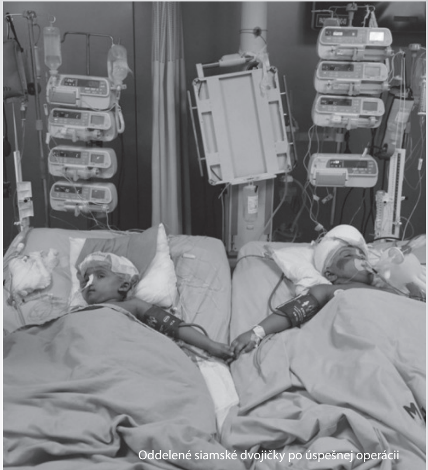
Oddelené siamské dvojičky po úspešnej operácii