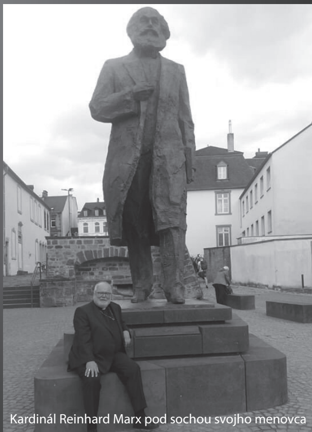
Kardinál Reinhard Marx pod sochou svojho menovca

inak): „Kapitál (Das Kapital)“ a tvrdí, že revolucionárovo názory, historicky vzaté, prispeli k zrodu sociálnej náuky cirkvi, ktorá by asi bez neho nevznikla. Takéto vyjadrenia sú z úst katolíckeho preláta dosť nešťastné. Osobne si neviem predstaviť, že by s nimi súhlasil pápež Lev XIII., autor encykliky „Rerum novarum“, ktorou položil základ pre vznik katolíckej sociálnej náuky ako vedy.