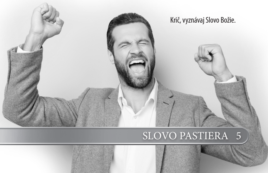
Krič, vyznávaj Slovo Božie.