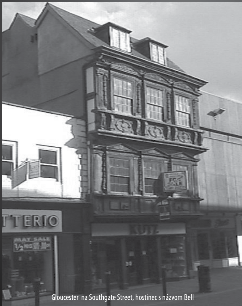
Gloucester na Southgate Street, hostinec s názvom Bell

Veľakrát to chceme mať v živote ľahké. Život s Bohom na zemi si predstavujeme ako prechádzku rajskou záhradou, ako život v bavlnke, bez problémov, prekážok, ťažkostí. Len požehnanie a požehnanie a požehnanie. Je to neodškriepiteľná veľká biblická pravda, že Boh je žehnajúci Boh a Jeho ľud je a má byť požehnaný. Má byť požehnaný, áno, ak niekto má byť požehnaný, tak to je Boží ľud - kresťania.