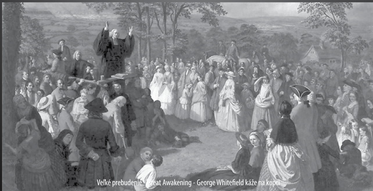
Velké prebudenie - Great Awakening - George Whitefield káže na kopci