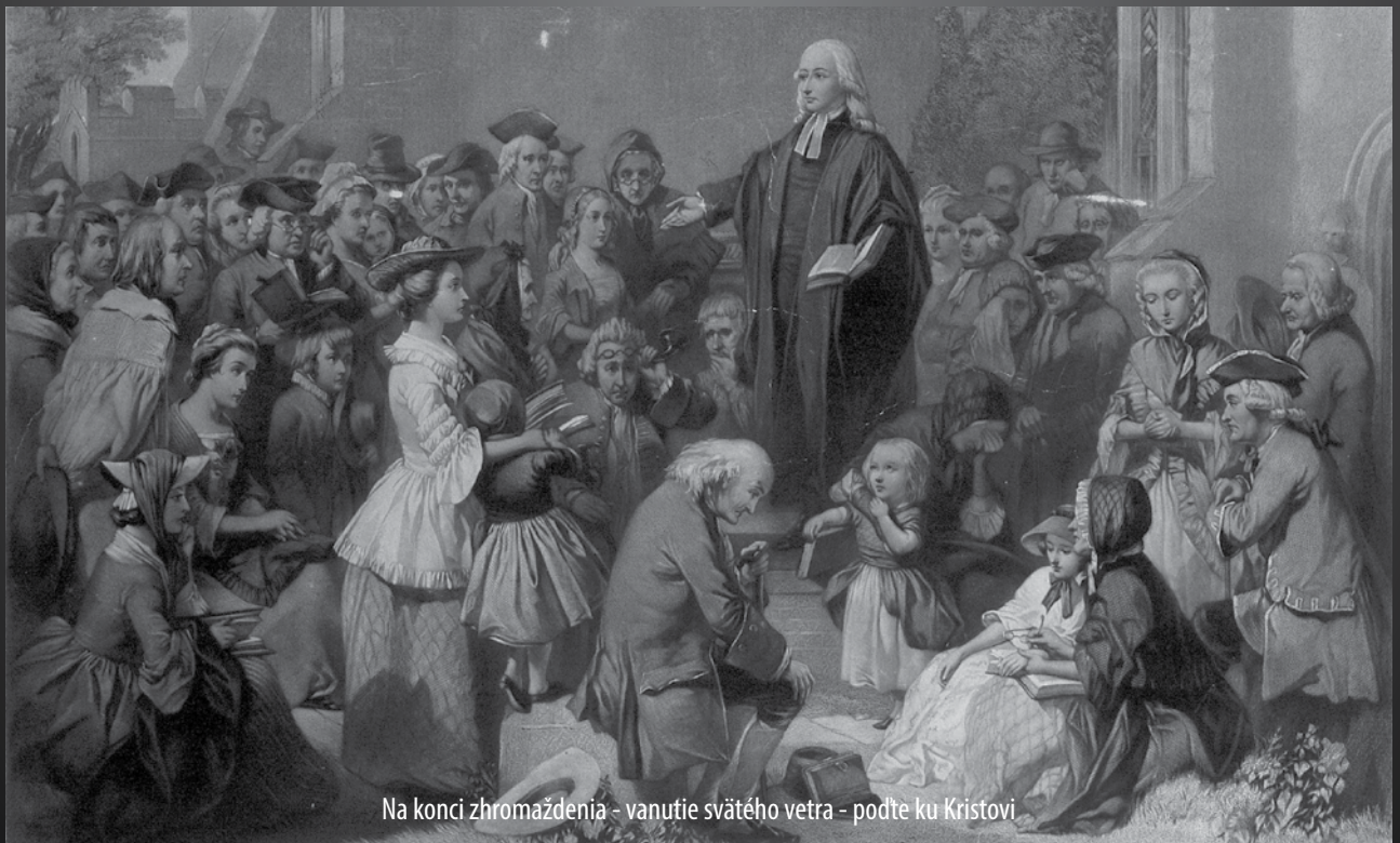
Na konci zhromaždenia - vanutie svätého vetra - podte ku Kristovi