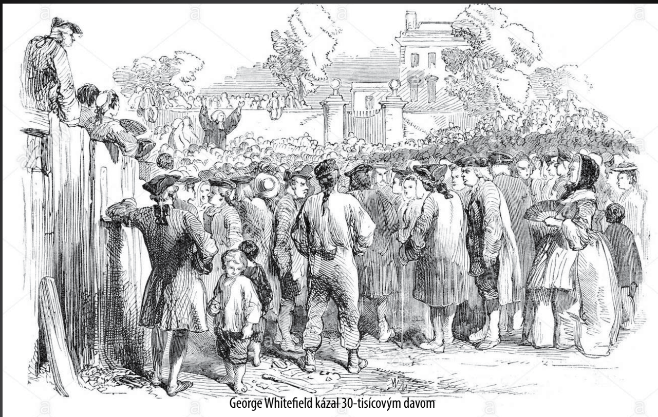
George Whitefield kázal 30-tisícovým davom

ju čítal už ako mladý chlapec neskoro do noci. Už v útlom detstve sa začala u neho prejavovať vášeň a schopnosť pre divadelné vystupovanie, čo sa najviac a veľmi intenzívne prejavilo neskôr v jeho kazateľskej službe. Boh ho vyzbrojil týmito darmi, aby si mohol cez jeho službu pritiahnúť k sebe státisíce duší. Študovať začal na Crypt School v Gloucestri a pokračoval na Vysokej škole Pembroke College v Oxforde. Nemal to ľahké ani na vysokej škole, ba práve naopak. Na vysokú školu sa dostal na štipendium, ako jeden z posledných. Úplne na konci zoznamu prijatých študentov. Lebo pochádzal z veľmi chudobných pomerov a nemal si z čoho platiť študijné náklady. Aby boli nejakým kompenzované jeho náklady na štúdium, musel robiť rôzne služby pre majetnejších študentov z vyššej spoločnosti, zo zámožných rodín. Musel týchto spolužiakov ráno budiť, čistiť im topánky, upratovať ich izby, nosiť knihy do školy. A v mnohých prípadoch im musel napísať aj ich seminárne práce. Ale Georg sa nestážoval, znášal to hrdinsky, ba čo viac, zobral to ako službu a robil to aj rád. Boh ho pripravoval aj týmto spôsobom na nádhernú vznešenú službu hlásania evanjelia. Krátko pred nástupom na štúdiá do Oxfordu sa znovuzrodil vierou v Ježiša Krista. Práve na Oxforde sa stretol