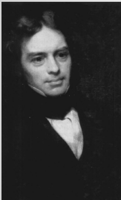
Michael Faraday (1791 - 1867)