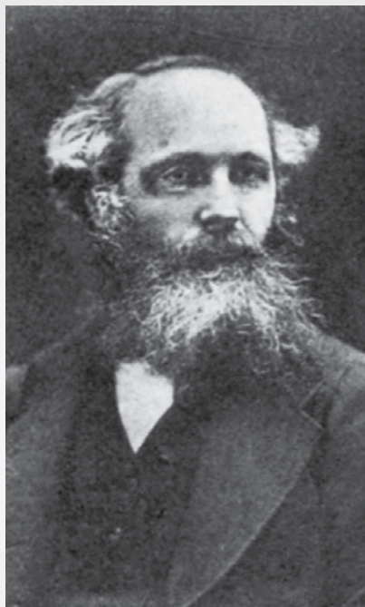
James Clerk Maxwell (1831-1879)