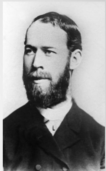
Heinrich Rudolf Hertz (1857 - 1894)

V jednom zo starších čísel sme písali o geniálnom vedcovi Michaelovi Faradayovi. Bol to on, ktorý objavil jav elektromagnetickej indukcie a tým de facto objavil a dal k dispozícii celému ľudstvu neviditeľnú sieť elektromagnetických polí. Jeho objav bol kľúčový a mal obrovský dopad a ďalekosiahle následky na celé prírodné vedy a chápanie sveta. Bol to muž považovaný vedeckou obcou bez akékoľvek páťosu za vôbec najvýznamnejšieho Jeho vedca a zároveň za najväčšieho experimentátora všetkých čias ľudskej histórie. Vedecké úsilie učinilo elektromagnetizmus použiteľným na technologické účely a jeho