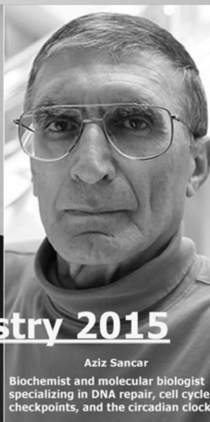
Aziz Sancar Biochemist and molecular biologist specializing in DNA repair, cell cycle checkpoints, and the circadian clock