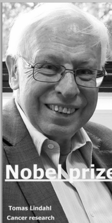
Tomas Lindahl Cancer research