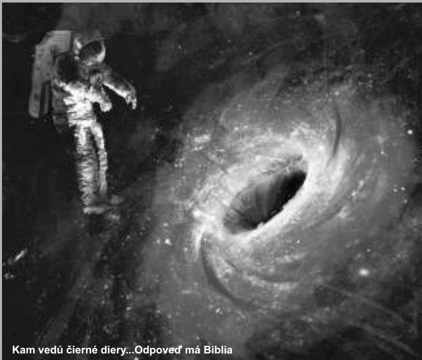
Kam vedú čierne diery... Odpoveď má Biblia