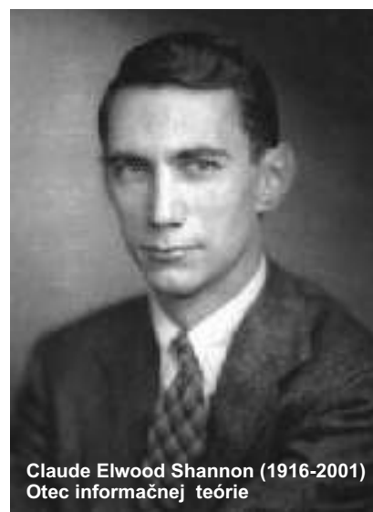
Claude Elwood Shannon (1916-2001) Otec informačnej teórie