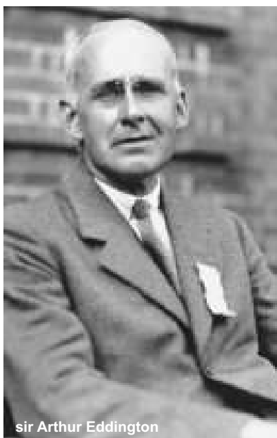
sir Arthur Eddington

Niet informácie bez vysielача, bez vôle, duchovného pôvodcu, duchovného zdroja. Informácia nie je hmotná veličina.