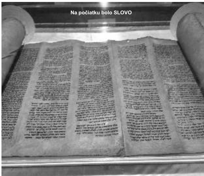
Na počiatku bolo SLOVO

„Na počiatku bolo Slovo a to Slovo bolo u Boha a to Slovo bol Bôh. Ten, to Slovo bolo na počiatku u Boha.