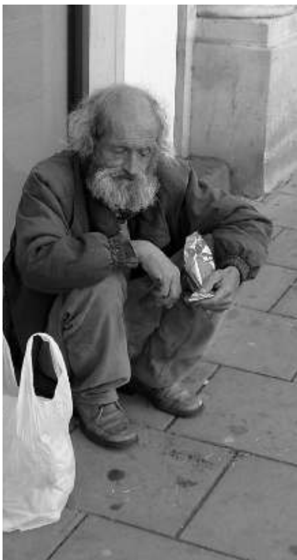
Boh koná zmeny