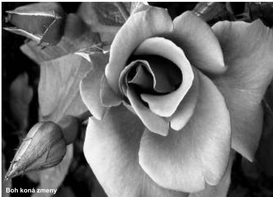
Boh koná zmeny