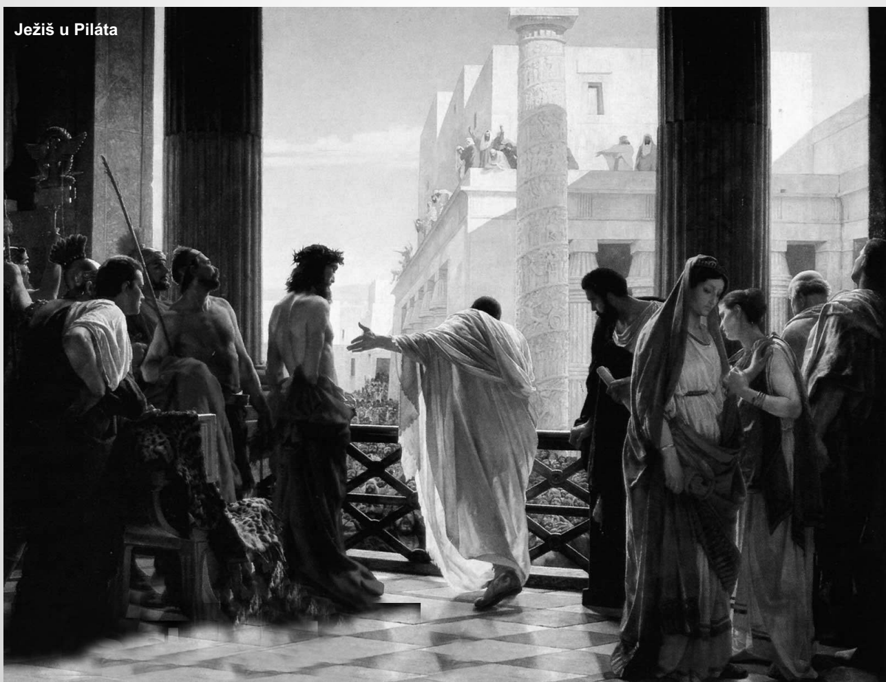
Ježiš u Piláta

Zo strany Piláta je vec ešte jednoduchšia, pretože on, Rímom ustanovený správca provincie (mylne na niektorých miestach titulovaný ako protektor), mal povinnosť presadzovať rímske právo v provincii Judea. Rímske právo však platilo len pre rímskych občanov, ktorým Ježiš jednoznačne nebol. A keďže nebol rímskym občanom, nemal v zmysle rímskeho práva ani nárok na riadny proces - takže zas nemohlo dôjsť