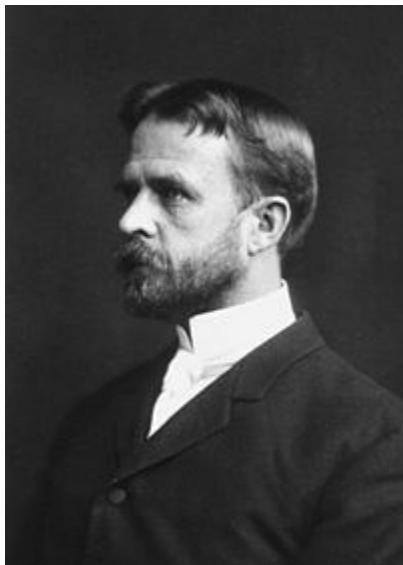
Thomas Hunt Morgan nositeľ Nobelovej ceny za fyziológiu a medicínu

Čujme, čo hovoria dvaja renomovaní a fundovaní vedci, kapacity uznávané vo svojej oblasti ako napríklad Thomas Hunt Morgan, nositeľ Nobelovej ceny za prácu na poli dedičnosti: