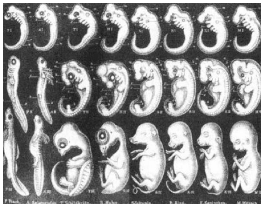
kresba-vedomý podvod a podvrh nemeckého zoologa Ernesta Haeckela na podporu nedokázateľnej darwinovej evolučnej tórie