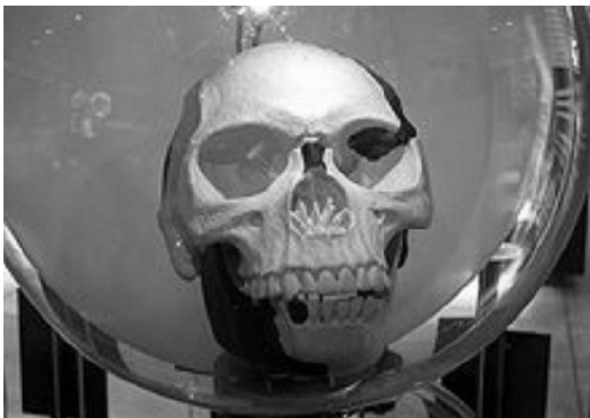
40 rokov trvajúci podvrh: Lebka Piltdownského človeka - lebka z antického muža, čelusť z orangután; replika

Hospodine, vod' ma vo svojej spravodlivosti pre tých, ktorí ma strežú. Urovnaj predomnou svoju cestu. Lebo niet stáleho v jeho ústach. Ich nútro je zývajúca priepasť, ich hrdlo otvorený hrob, a jazykom lichotia. Uvaľ na nich, ó, Bože, ich vinu! Nech padnú od svojich rád; zažeň ich pre množstvo ich prestúpení, lebo sa tí protivia.