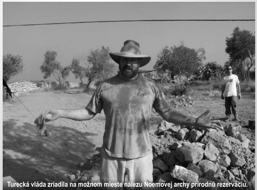
Turecká vláda zriadila na možnom mieste nálezu Noemovej archy prírodnú rezerváciu.

Napriek tomu, ako som už spomenul, bez akejkoľvek pochybnosti turecká vláda zriadila na danom území prírodnú rezerváciu.