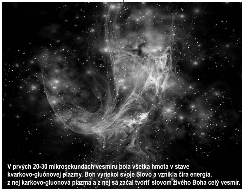
V prvých 20-30 mikrosekundách vesmíru bola všetka hmota v stave kvarkovo-gluónovej plazmy. Boh vyriekol svoje Slovo a vznikla číra energia, z nej kvarkovo-gluónová plazma a z nej sa začal tvoriť slovom živého Boha celý vesmír.

Čiže, ako pracuje Božia viera, ktorou Boh stvoril nebesia aj ich vojsko, celučký vesmír, viditeľnú i neviditeľnú (skrytú) materiu, viditeľnú i neviditeľnú (skrytú) energiu, svetlo - prúd fotónov, galaxie, slnečnú sústavu, našu Zem a všetky semená na nej, celú faunu a flóru ...?