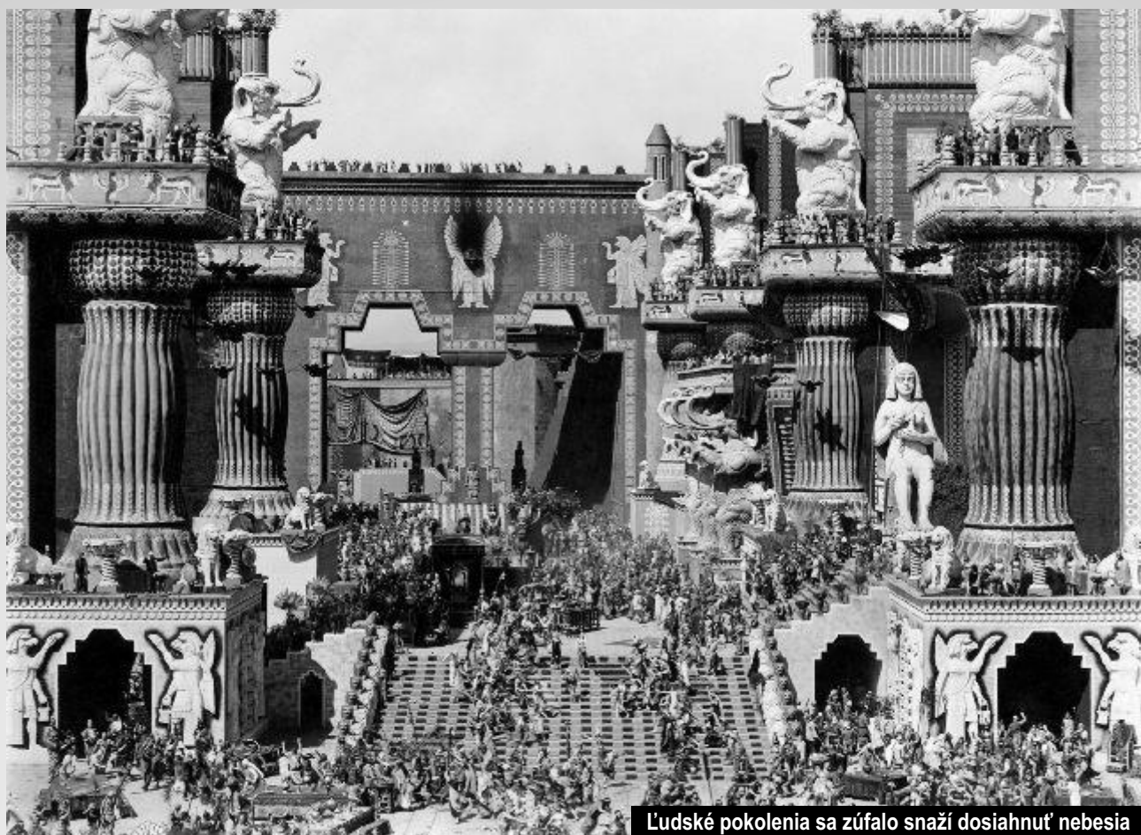
Ludské pokolenia sa zúfalo snaží dosiahnuť nebesia