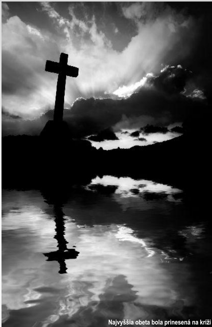
Najvyššia obeta bola prinesená na kríži

Alebo práve naopak, vstupuje do človeka bičovaného neschopnosťou dosiahnuť naplnenie svojich duchovných, duševných, materiálnych, sociálnych a všetkých možných potrieb a ponúka riešenie na ten páličivý smäd a hlad v duši oboch typoch týchto ľudí a všetkých možných nuansov tejto rapsodickej práce v človeku s ponukou svojich odporých majestátnych či neuveriteľne prostých aj sprostých falzifikátov, podvrhov, ktorými sa človek zúfalo snaží dosiahnuť nebesia, Boha, Jeho