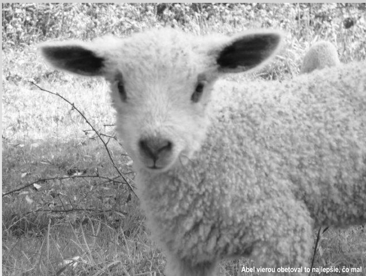
Ábel vierou obetoval to najlepšie, čo mal

Áno, Ábel sa spomína v Biblii ako prvý muž, ktorý mal niečo dočinenia s vierou, s tou skutočnosťou, s ktorou ako s jedinou dokážeme vstúpiť do obecnstva a komunikácie s Bohom, získať Jeho pozornosť, priazeň, nakloniť si Ho.