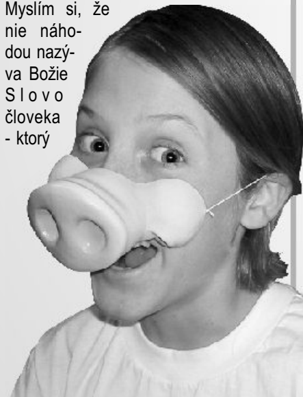
Človek bez Boha ...

nie náhodou nazýva Božie Slovo človeka - ktorý