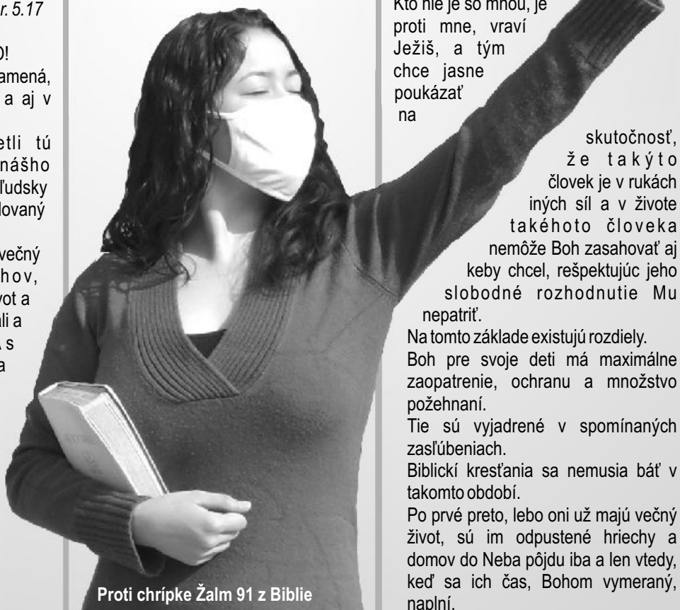
Proti chrípke Žalm 91 z Biblie

Nie je to v tom, že by sa vírus nesnažil útočiť na veriacich aj neveriacich. Diabol, ktorý za tým všetkým stojí, nenávidí rovnakou mierou celé ľudské pokolenie, kresťanov i nekresťanov. On útočí na každého bez rozdielu. Satan je ukrutný, nemilosrdný vrah, zlodej. (Ján 10.10)