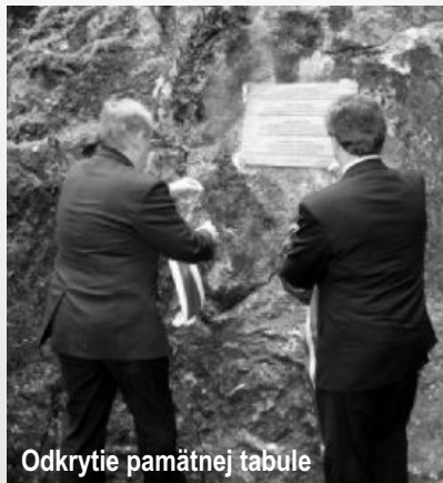
Odkrytie pamätnej tabule

krátkom procese nechá zhodiť z najvyššej bašty svojho hradu. Zaujímavosťou snáď je len to, že tento stredoveký mafián a výpalník bol ešte v roku 1533 Fischerovým ochrancom.