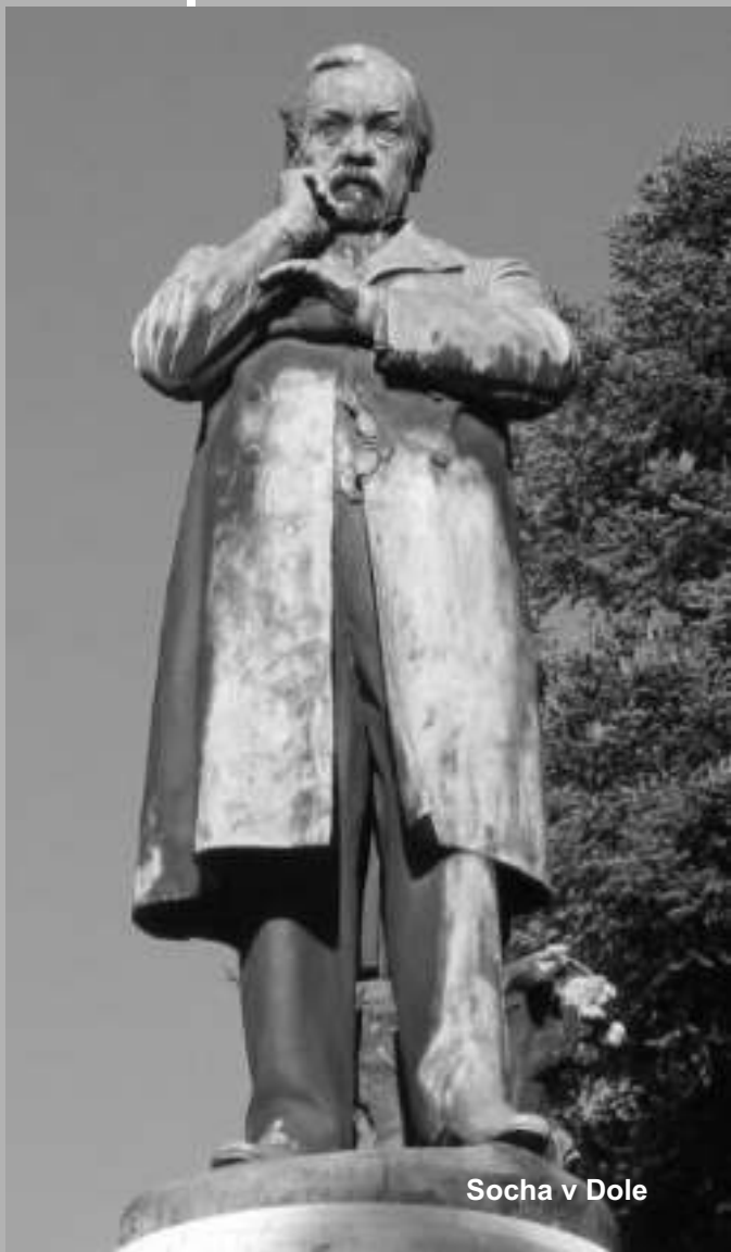
Socha v Dole

Na celom tom objave ho najviac fascinovala zložitá štruktúra malých kryštálikov, na ktoré pozeral ako na priame dôkazy umeleckého vyjadrenie sa Boha v zložitých kryštalických štruktúrach. Jednoducho, Boha neopúšťal ani pri práci v laboratóriách, naopak,