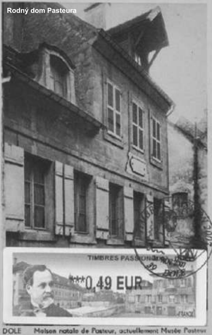
Rodný dom Pasteura

a imunológie a stal sa najväčším dobrodincom a najväčším biológom svojho času.