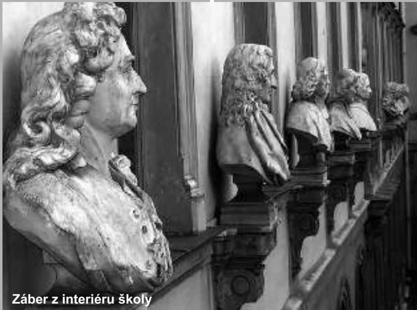
Záber z interiéru školy

Pasteur národným hrdinom a nositeľom mnohých domácich i zahraničných pôct. Francúzsky štát mu nepoďakoval len doživotnou rentou, ale na počtu zriadil „Pasteurov inštitút“ ako výskumné stredisko, v ktorom bol Pasteur až do svojej smrti riaditeľom. Z lekárskej fakulty v Bonne obdržal „úctivý diplom doktora“, ktorý však s veľkým protestom počas nemecko-francúzskej vojny poslal naspäť. Na jeho hrobke sú vyryté názvy jeho objavov, ale v jeho srdci a nad jeho životom boli vyryté slová, ktoré aj dnes znejú a volajú na všetkých ľudí, poukazujúc na to, kto a čo stálo za jeho objavmi a mimoriadne plodným vedeckým životom.