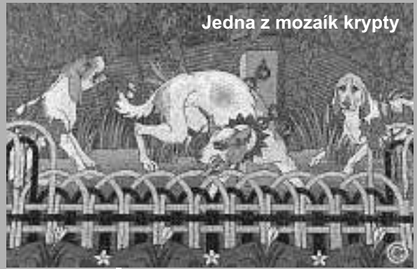
Jedna z mozaík krypty

aby bolo, jako je napísané: Ten, kto sa chváli, nech sa chváli