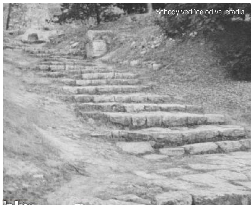
Schody vedúce od večeradla

Ame, ame vám hovorím, že kto verí vo mňa, skutky, ktoré ja iním, bude aj on iní a ešte aj väčšie, lebo ja idem ku svojemu Otcovi.