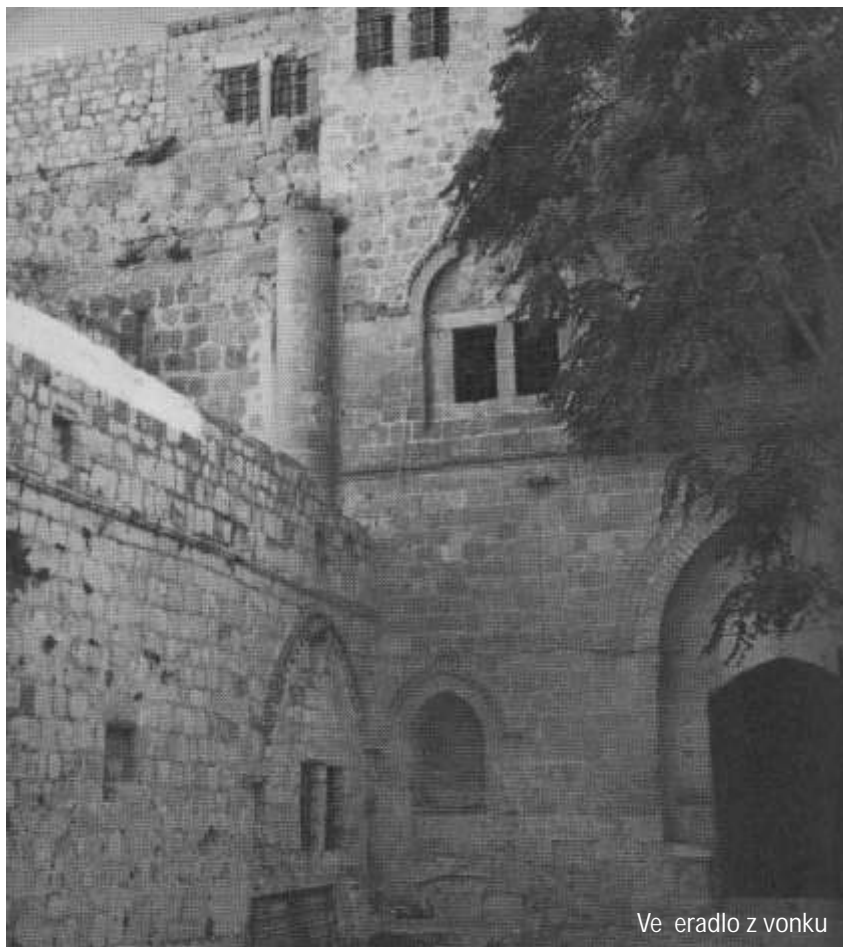
Večeradlo z vonku

„Jestli ma niekto miluje, ten bude ostríha moje slovo, a môj otec ho bude milovať, a príjdem k nemu a urobíme si u neho príbytok.” (Ján 14.23)