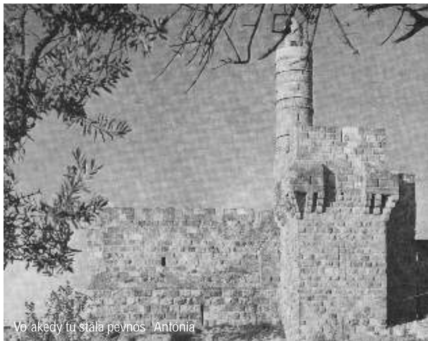
Vo akedy tu stála pevnos Antónia

vládou Rímskej ríše, na ele ktorej bol vtedy cisár Augustus a celú Palestínu spravoval Herodes