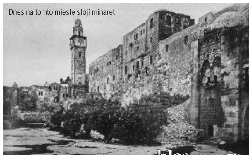
Dnes na tomto mieste stojí minaret

istými slovami vás vítam pri našom putovaní touto obdivuhodnou krajinou Božieho Syna. V najbližších íslach Hlasu viery si popíšeme miesta, ktoré boli priamo dejiskom posledných dní, ba až hodín v živote nášho Spasite a. Jedným takýmto miestom je pevnos Antónia v Jeruzaleme. Postavi ho dal Herodes Ve ký, ktorý dal zreštaurova celý chrám, obohnal ho múrom a dal postavi aj pevnos Antonia, ktorá mala slúži