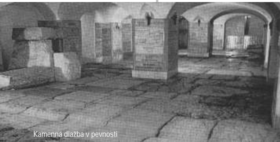
Kamenná dlažba v pevnosti

V ase Ježišovho narodenia bolo celé územie Palestíny pod