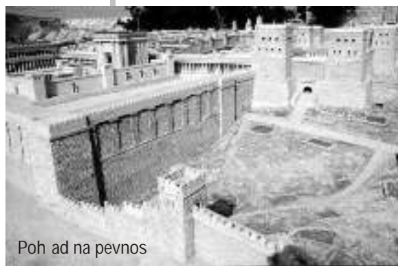
Poh ad na pevnos

na okultné praktiky. Pilát, ke prišiel v úradných záležitostiach do Jeruzalemu, býval v Herodovom paláci, ale jednanja viedol v pevnosti Antonia. Pevnos sa nazývala aj Pretórium, o znamená Pilátov dom a pochádzal z gréckeho slova Prai-tor-ion. Je najpravdepodobnejšie, že práve tu v tejto pevnosti súdil Pilát aj nášho Pána Ježiša Krista pred Jeho ukrižovaním. (Ján 18.kap.) Ako sa predpokladá stál na kamennej dlažbe, ktorá bola jej sú as ou, na mieste zvanom litostróton židovsky gabata (v preklade vyvýšené miesto). Odtia zazneli z úst Ježišových slová: „Moje krá ovstvo nie je z tohoto sveta...“ (Ján 18.36). Ja už len pridám krásny citát z Biblie: „Ale h adajte krá ovstvo Božie, a to všetko vám bude pridané“ (Lk. 12.31)