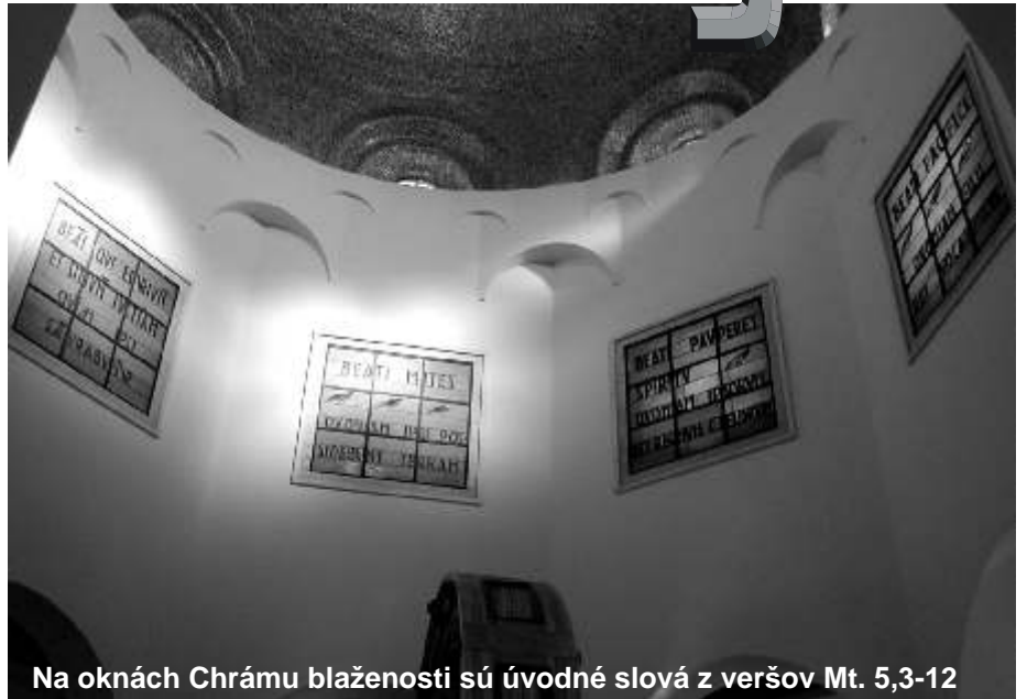
Na oknách Chrámu blaženosti sú úvodné slová z veršov Mt. 5,3-12

Je to krajina ležiaca pri severozápadnom kúte Galilejského jazera, ktorej nadmorská výška sa pohybuje v rozmedzí 700 až 200 stôp (213,5m až 61m) pod hladinou mora a ktorá svojím kónickým vrchom vytvára nádherný prírodný amfiteáter. Podľa kresťanskej tradície práve na úbočí tohto vrchu predniesol náš Pán Ježiš Kristus svoju reč, známu ako k á z e ň o blahoslavenstvách, a preto ju nazvali „horou kázne“ - Mt. Sermon.