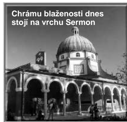
Chrámu blaženosti dnes stojí na vrchu Sermon

A sme pri ďalšej krajine, ktorá samotná pocítila prítomnosť nášho Pána Ježiša Krista, počula tu život prinášajúce Božie slová, videla zástupy ľudí túžiacich po uzdravení, po oslobodení, po známosti, po Božích dotykoch a zázrakoch. Tu zneli slová o tom, kto zdedí Božie kráľovstvo, kto bude potešený, kto bude nasýtený, ....., učenie, napríklad o spravodlivosti, o zákone, o rozvode, o prísaha, o čistote, o láske, o almužne, o poklade, o modlitbe i o tom, že všetko nám bude pridané, ak na prvé miesto vo svojom živote postavíme Boha a budeme hľadať Jeho Kráľovstvo.