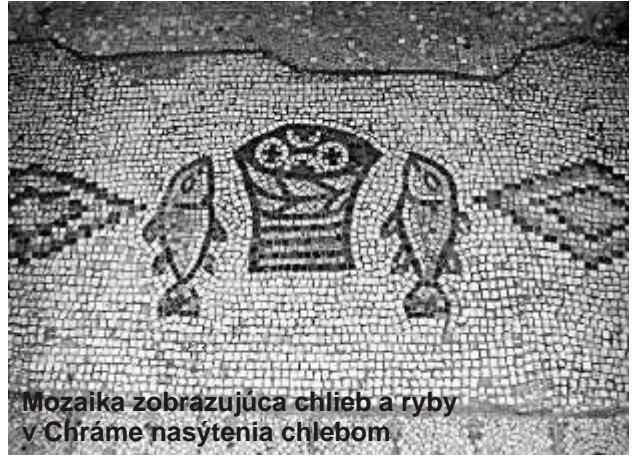
Mozaika zobrazujúca chlieb a ryby v Chráme nasýtenia chlebom

Barluzziho. Koncom 30. rokov 20. storočia navrhol stavbu v neorenesančnom slohu, pozostávajúcu z kontrastne farebne ladených kameňov (čierny čadič a biely vápenec) a situovanú na samotný vrchol hory. Pôdorys kupoly chrámu je v tvare osemuholníka, na stenách sú okná s